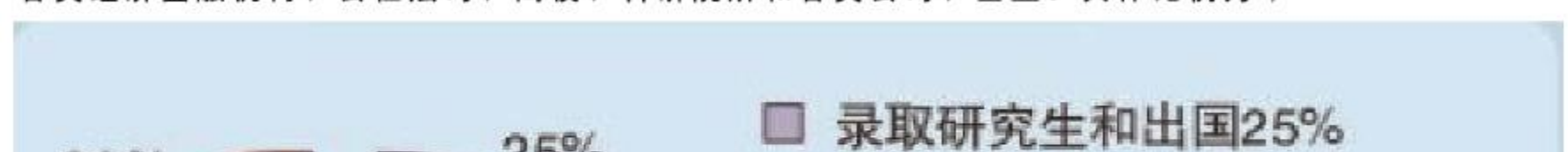
近两年在国家专项、高校专项在江苏省录取情况一览表