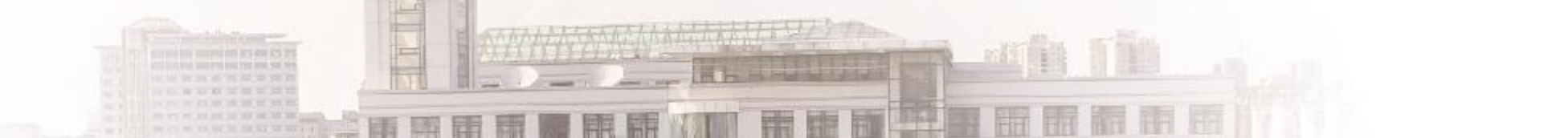
近两年在国家专项、高校专项在江苏省录取情况一览表